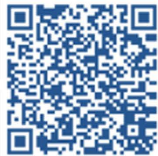
Трудоустройство и развитие карьеры ветеранов (участников) СВО