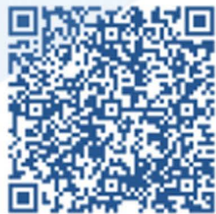
Содействие в поиске работы по месту регистрации с выплатой пособия