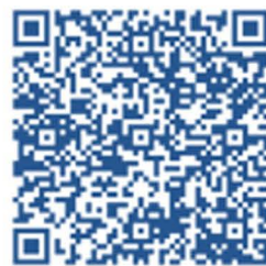
Содействие в поиске работы в любом регионе без выплаты пособия